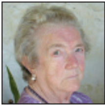
• Zorionak, amuma Nika-sil 85 patxo denon partez, eta bihar ondo pasa.