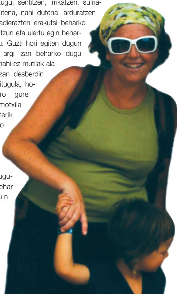
"Nire txanda" atalean idatzi nahi baduzu, jarri zaituz gurekin harremanetan: 943 74 41 12 edo barren@elgoibarkoizarra.com

"Hezten dugun moduari buruz hausnartzen dudanean egiten dugunari buruzko duda asko sortzen zaizkit"