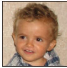
• Zorionak! Bi urte eta umore horrekin bizitza alaitzen! Hau tipua hau!