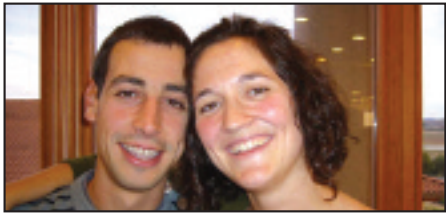
• Zorionak, pareja! Ondo pasau zuen ezkontza egunean. Koadrilakoen partez.