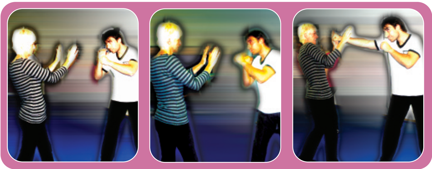
Erasotzaile baten aurrean distantzia jarri behar da eta eskuak altxatu zure burua defendatzeko.

Biolazio kasua da, akaso, ezezagun batengandik jaso daitezkeen erasorik gogorrena. “Biolatzen saiatzen badira, argi dago garrasika hasteak ez duela ezertarako balio, lortuko dugun bakarra erasotzaileak gehiago jotzea da. Ahal den neurrian lasai egoten saiatu behar da, eta besteak gutxien espero duenean, kolpea ematen saiatu: begietan, sudurrean... Horretarako, gugana gerturatu beharko dugu, eta horrek beldurra ematen badu ere, ihes egiteko era bakarra da”, nabarmendu du.