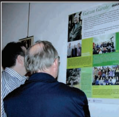
Erakusketan, Gotzonen liburu eta lanak ez ezik, Gotzonen izaera eta bizitza hobeto ezagutzeko hainbat panel ikus daitezke.