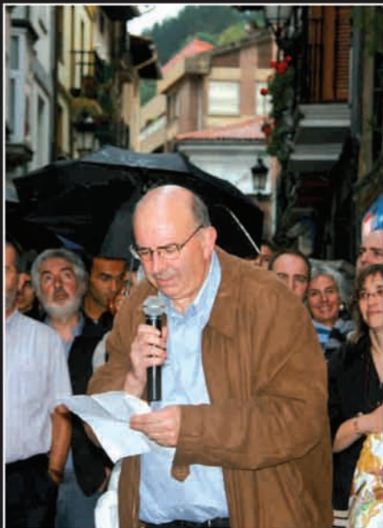
Oroitarria bistaratu ondoren, Gotzonen jaiotetxea bedeinkatu zuen Benantzio parrokoak.