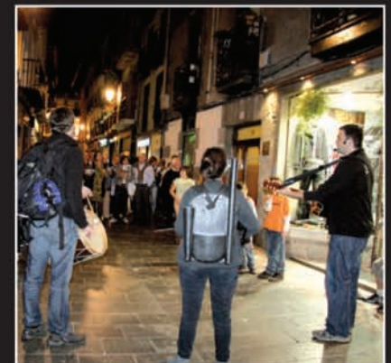
Erakusketa inauguratu ondoren, kantu kalejira izan zen Kultur Etxean hasi eta Madalaraino.