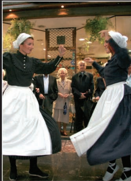
Polita eta hunkigarria izan zen Gotzonen ilobek etxearan aurrean dantzan egin zuten uea.