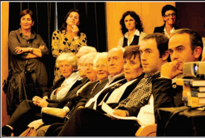
Elgoibarko alkatea eta Elgoibarko Izarrako presidentea Gotzonen anai-arreben alboan egon ziren omenaldiak iraun zuen artean.