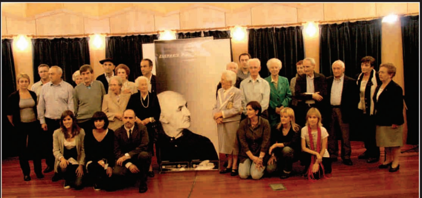
Erretratuan, Gotzonen anai-arrebak, omenaldiko eragileak, eta omenaldian parte hartu zuten batzuk ikusi ditzakegu, denak Gotzonen inguruan.