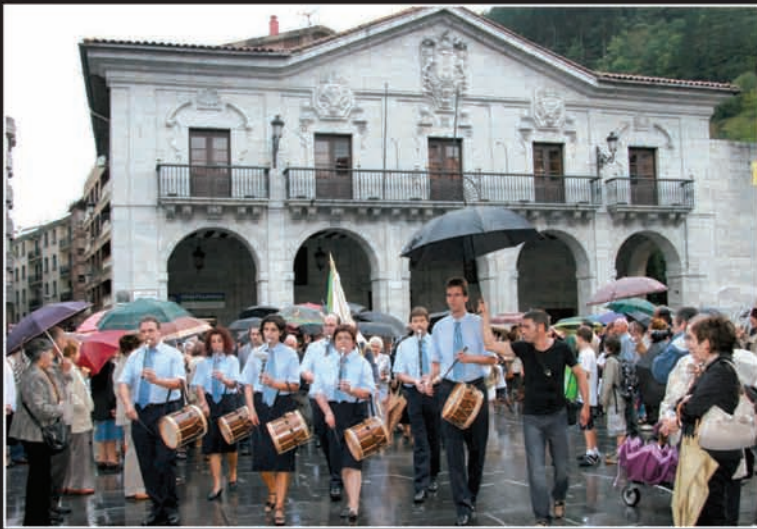
Plaza Handira deituta zeuden urriaren 8an Gotzonen omendu nahi zuten herritarrek. Herriko plaza jendez beteta zegoen arratsaldeko 19:00etan.