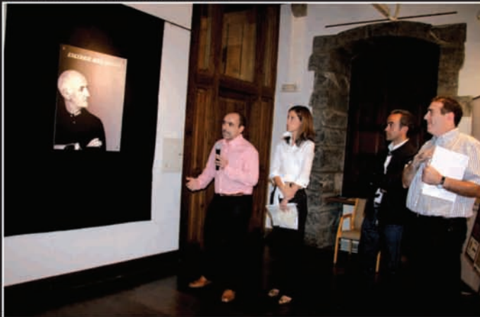
Urriaren 9an Gotzonen lanen gaineko erakusketa inauguratu zen Kultur Etxean. Urriaren 23ra arte egongo da zabalik erakusketa.