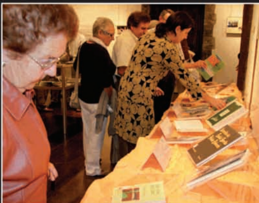
30 liburu inguru argitaratu zituen Gotzonek; denak daude ikusgai erakusketan.