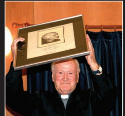
Anai-arreba guztien izenean, Romanek jaso zuen antolatzaileek egindako erregalua.