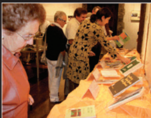
30 liburu inguru argitaratu zituen Gotzonen; denak daude ikusgai erakusketan.