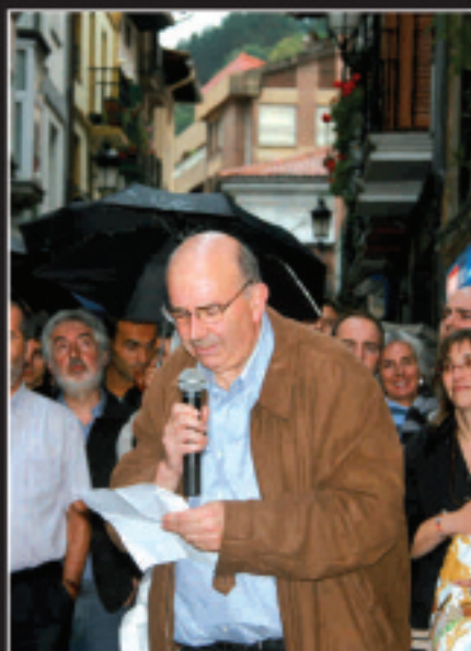
Oroitarria bistaratu ondoren, Gotzonen jaiotetxea bedeinkatu zuen Benantzio parrokoak.