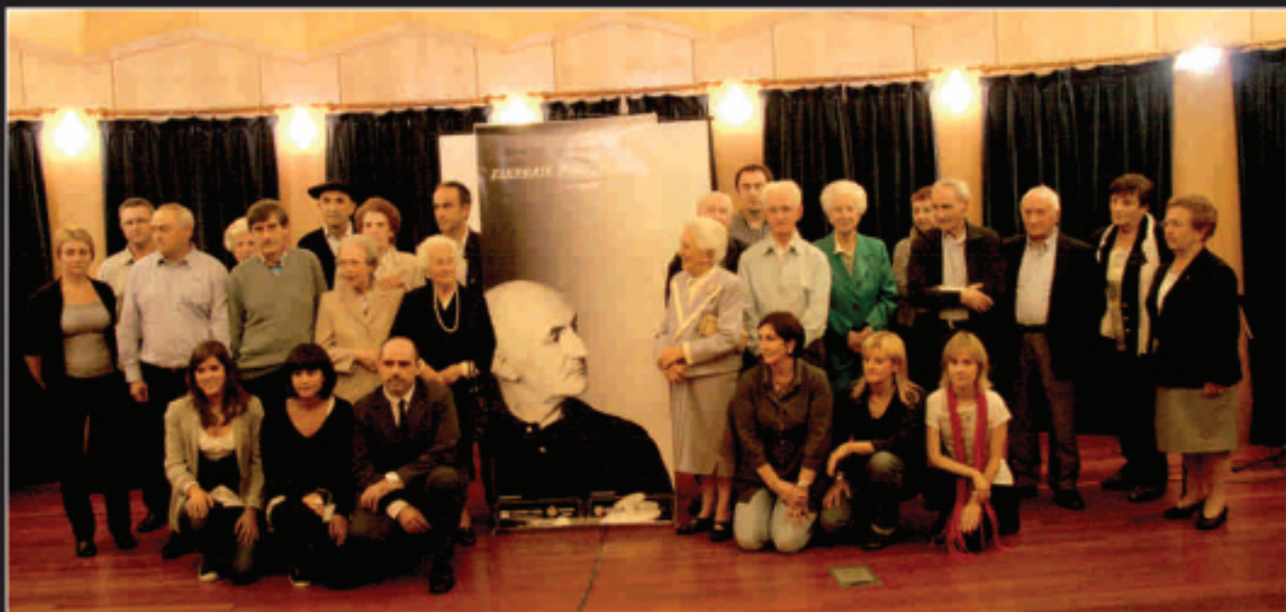
Erretratuan, Gotzonen anal-arrebak, omenaldiko eragileak, eta omenaldian parte hartu zuten batzuk ikusi ditzakegu, denak Gotzonen inguruan.