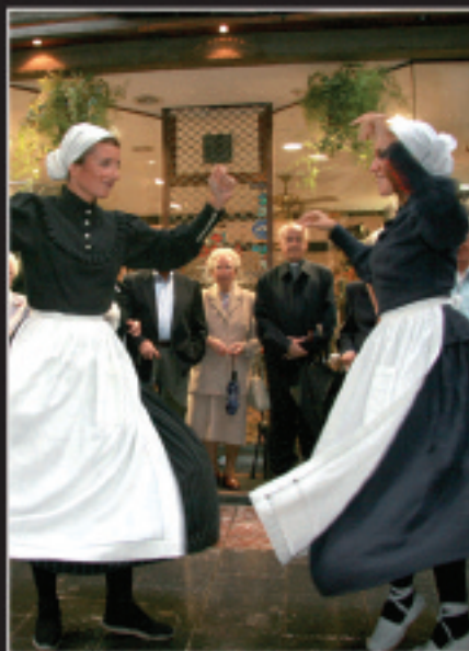
Polita eta hunkigarria izan zen Gotzonen ilobek etxearan aurrean dantzan egin zuten unea.