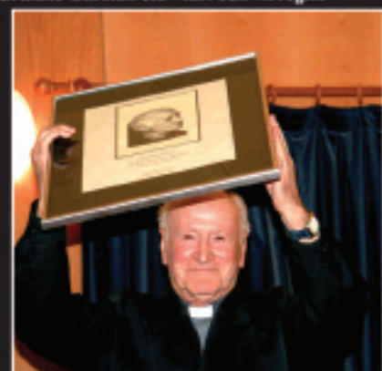
Anal-arreba guztien izenean, Romanek jaso zuen antolatzaileek egindako erregalua.