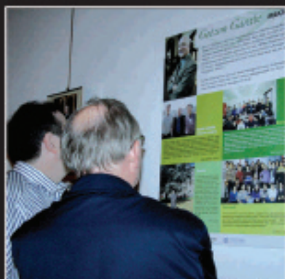
Erakusketan, Gotzonen liburu eta lanak ez ezik, Gotzonen izaera eta bizitza hobeto ezagutzeko hainbat panel ikus daitezke.