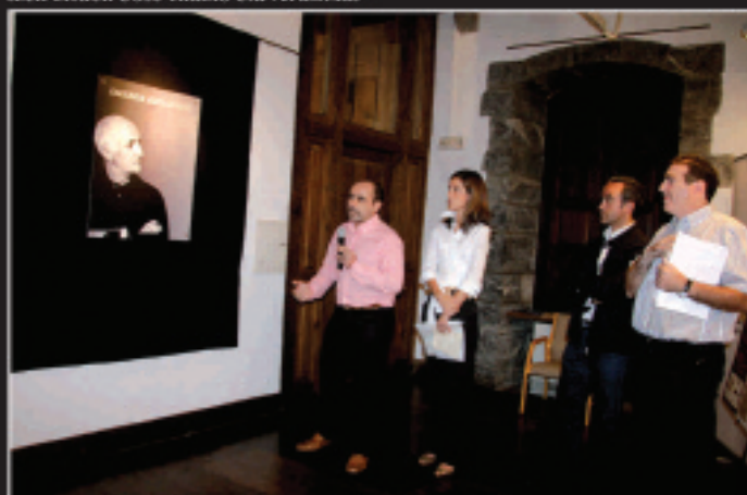
Urriaren 9an Gotzonen lanen gaineko erakusketa inauguratu zen Kultur Etxean. Urriaren 23ra arte egongo da zahalik erakusketa.