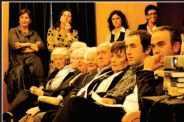
Elgoibarko alkatea eta Elgoibarko Izarrako presidentea Gotzonen anal-arreben alboan egon ziren omenaldiak iraun zuen artean.