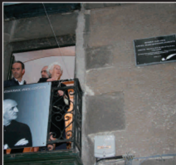
Anitak, arreba zaharrenak, bistaratu zuen Gotzonen omenez haren jaiotetxean jarritako oroitarria.