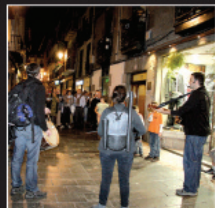
Erakusketa inauguratu ondoren, kanta kalejira izan zen Kultur Etxean hasi eta Madalaraino.