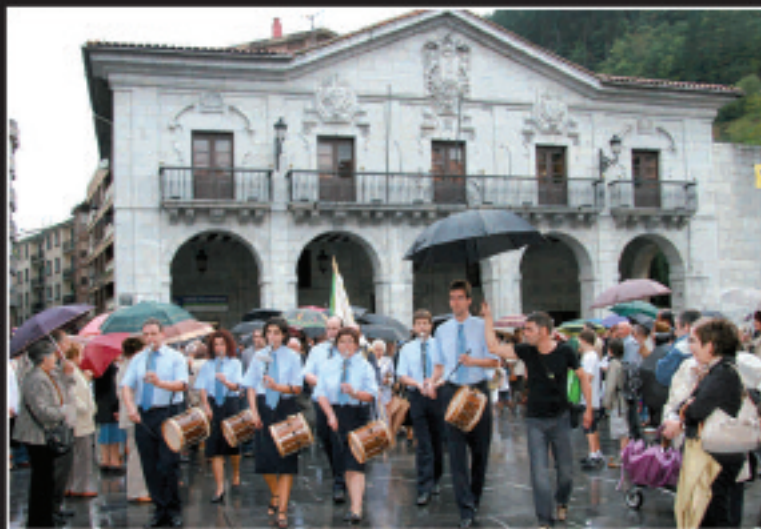
Plaza Handira delituta zeudea urriaren 8an Gotzonen omendu nahi zuten herritarrek. Herriko plaza jendez beteta zegoen arratsaldeko 19:00etan.